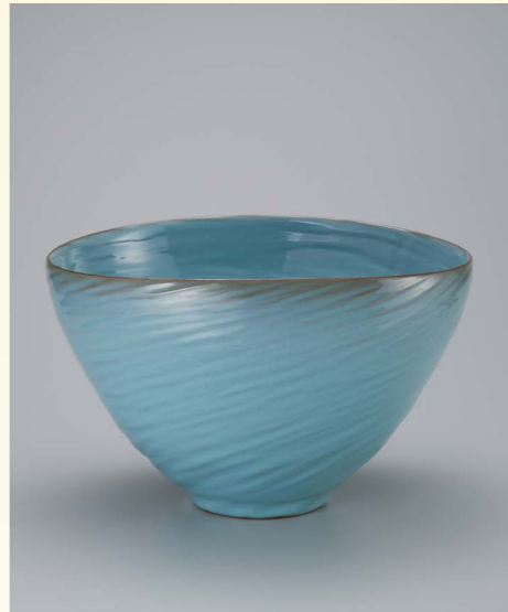
日本経済新聞社賞 せいじはち ふうは かきょう 青瓷鉢「風波香響」 多賀井 正夫