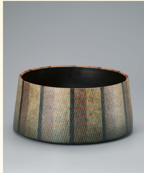
滋賀県知事賞 たいけいばち しゃよう 台形鉢「斜陽」 伊東 晃