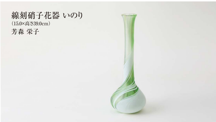
線刻硝子花器 いのり (15.0×高さ39.0cm) 芳森 栄子