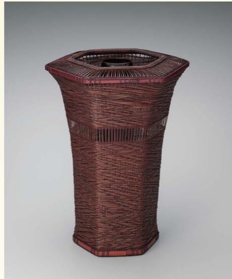
奈良県知事賞 はなかご 花籃「かわたれ」 上野 孝志