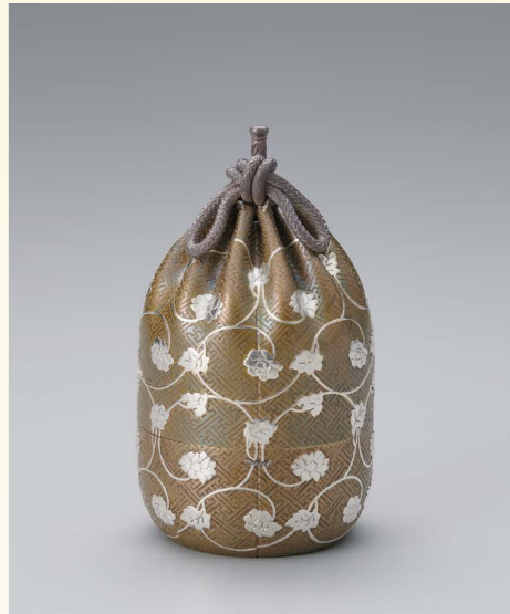
松下幸之助記念賞 おうどうじ こぎれもん よし ふくがたごう す 黄銅地古裂文様仕覆形合子 須藤 拓