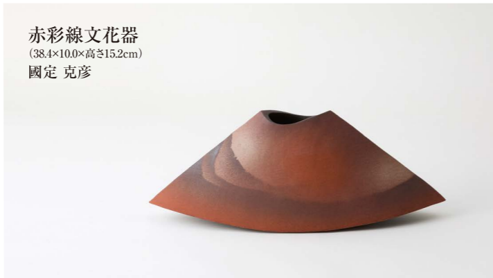
赤彩線文花器 (38.4×10.0×高さ15.2cm) 國定 克彦