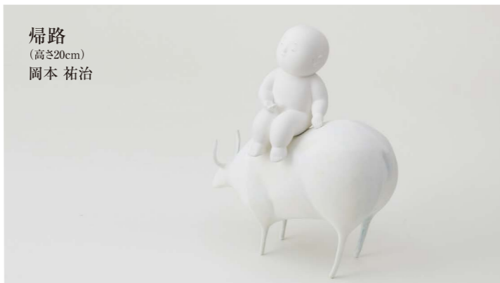
帰路 (高さ20cm) 岡本 祐治