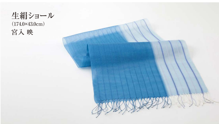
生絹ショール (174.0×43.0cm) 宮入 映