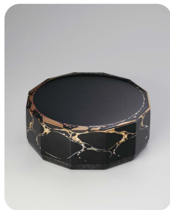
日本工芸会新人賞 じょうはなまきえかざりばこ「えくりおす」 城端蒔絵飾箱「Eclipse」 小原 治五右衛門