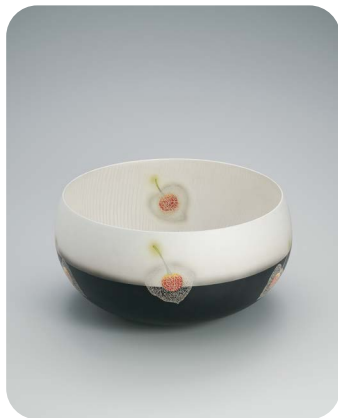
日本工芸会保持者賞 ぎんでいさいじほおずきもんはち 銀泥彩磁鬼灯文鉢 井戸川 豊