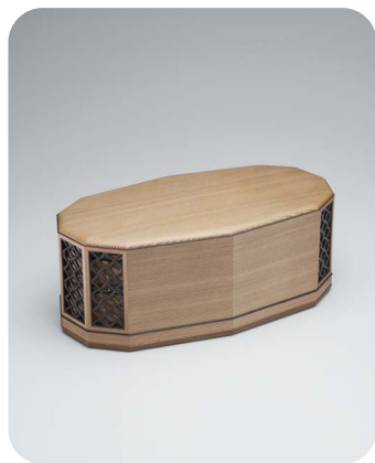
文部科学大臣賞 じんだいすきづくりばこ 神代杉造箱 角間 泰憲