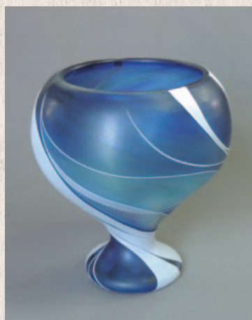
芳森 栄子 線刻硝子花器「空」