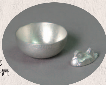
角谷 圭二郎 ミニ小鉢&箸置 「鴛鴦」